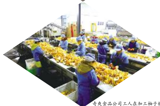
奇爽食品公司工人在加工柚子糖