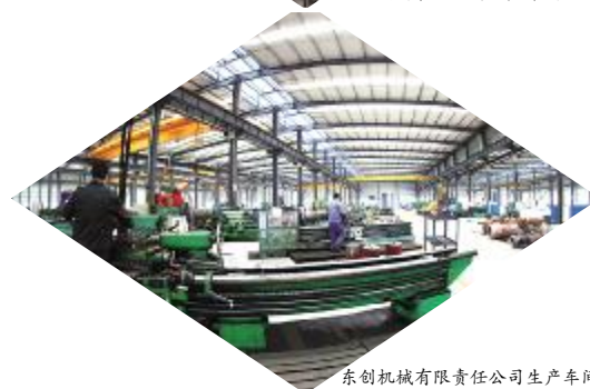
东创机械有限责任公司生产车间