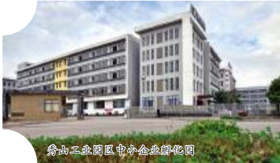
秀山工业园区中小企业孵化园

思路的嬗变,带来的是空间布局、发展重点的改变。该县经济从“一猛独大”发展到“四大绿色产业”,即:特色效益农业、特色工业、商贸物流业、民俗文化生态旅游。秀山县长向业顺说:“秀山把发展工业经济摆在更加突出的位置,改造传统工