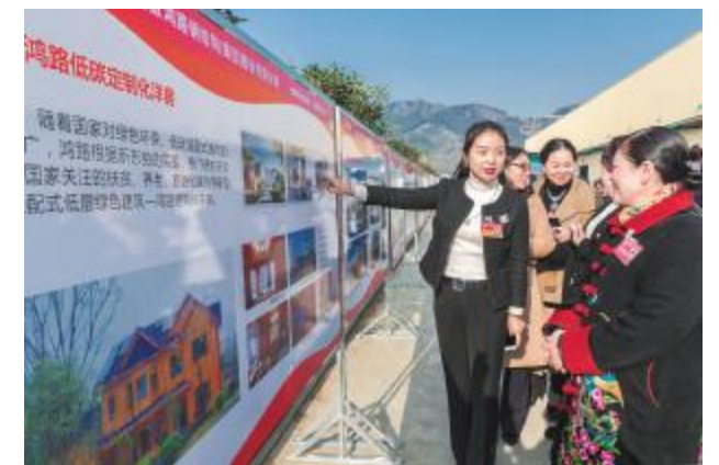
政协重庆市南川区第十四届委员会第二次会议1月11日开幕。为让委员们的建言献策更具针对性，该区政协前组织委员进工厂、进社区、走乡村视察调研，倾听来自第一线的民情民意。图为1月10日，该区政协委员在当地工业园区调研企业生产经营情况。