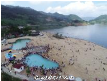
板辽金沙滩游人如织